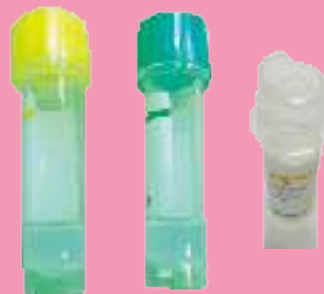
Jel分隔凝膠及傾斜口照片